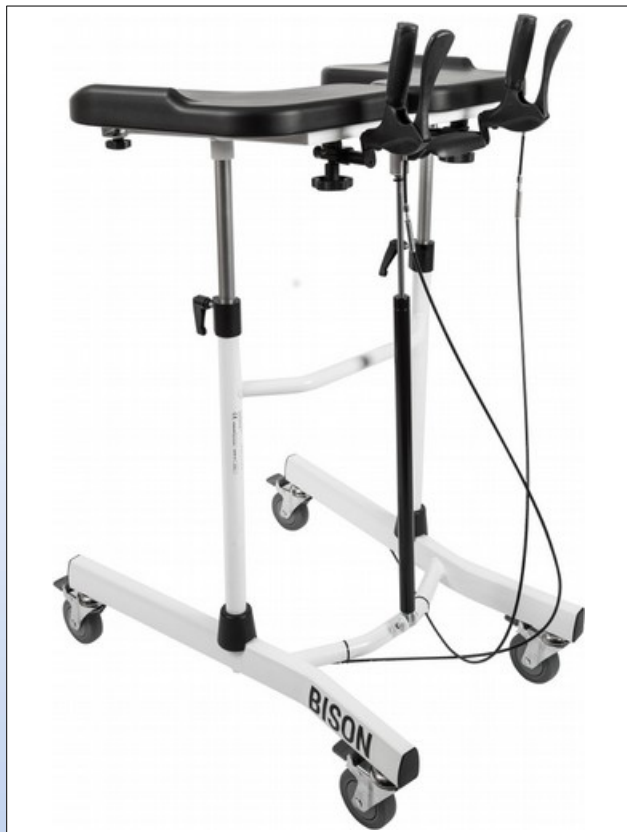
RBi1a. "Bison" gangbord

Mobilex Bison gangbord er et bevægelseshjælpemiddel til at lære og træne aktiv gang. Det kan også bruges som støtte ved balanceproblemer. Rammen er lavet af pulverlakeret aluminium. Bison har mange indstillingsmuligheder: Armstøtterne kan meget let højdeindstilles ved hjælp af gasfjedrene. Håndtagene med bremsearme kan vinkelindstilles. Alle disse indstillinger kan foretages uden værktøj. De håndbetjente bremses virker på baghjulene, og alle 4 hjul er udstyret med låsbare bremses. Den smalle bredde gør det også muligt at passere smalle passager.