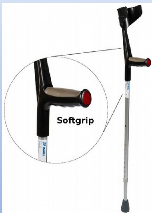
Q3a. Krykstok af aluminium med blødt greb

Krykstok af aluminium, sølv med sort håndtag og blødt greb