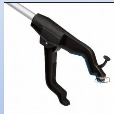
Q5e. Magnet i tang-enden

Gribetang med aluminium stang og ergonomisk håndtag. Gribetangen er udstyret med krog og magnet.