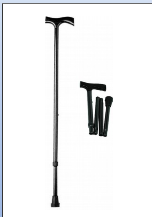
Q3b. Spadserstok af aluminium et stykke (venstre) eller foldbar (højre)