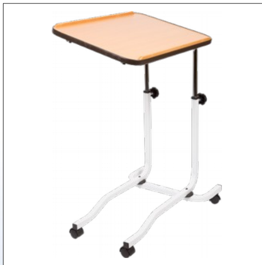
Q2. Sengebord på hjul

Sengebord med mange indstillingsmuligheder. Kan anvendes som både sengebord og læsepult. Højden på arbejdspladen kan indstilles fra 72 til 110 cm, og pladen kan vippe trinløst i begge retninger.