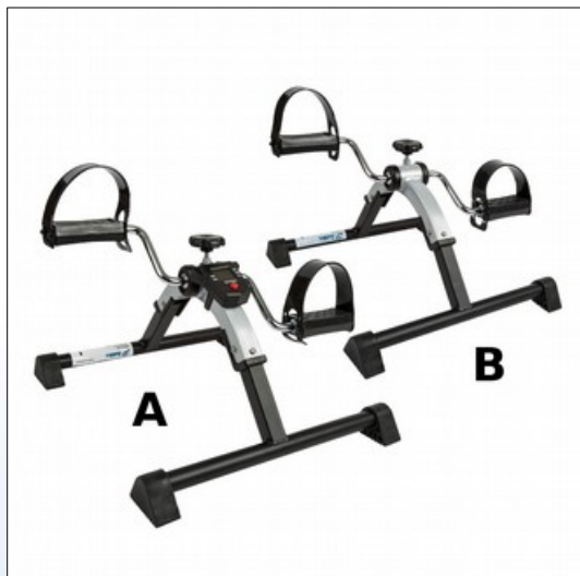
Q1. Pedaltræner med (A) eller uden (B) LCD

Simpel og robust arm- og bentræner med manuel indstillelig modstand. Kraftig metalramme med kunststofpedaler med justerbar rem. Tilgængelig med eller uden LCD display.