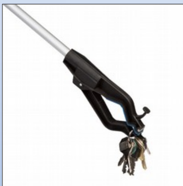
Q5c. Krog i tang-enden