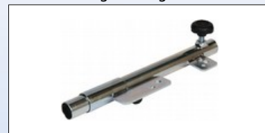
M2d. Armlænbeslag for 240001