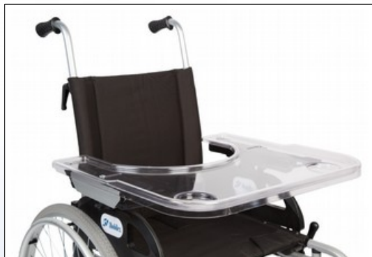
M1a. Universal terapibord monteret

Terapibordet er fremstillet i 6 mm brudsikkert, transparent materiale med kanter på 3 sider. Kan indstilles op til 9 cm i bredden, og for 28 – 58 mm polsterhøjde.