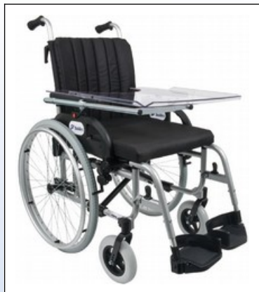
M2a. Terapiebord i brug

Målet på pladen er 57 cm x 38 cm (B x D) og den kan forskydes 8 cm