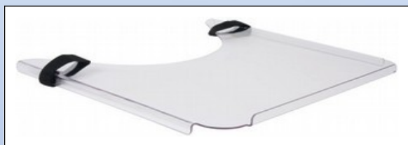
M3a. Terapiebord med velcrobånd

Universal terapibord for montage på armlæn. Terapibordet er fremstillet i 4 mm brudsikkert, transparent materiale med kanter på 3 sider. Terapibordet er fastgjort på armlænene ved hjælp af to velcrobånd.