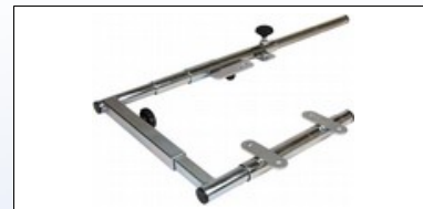
M2c. Montagebeslag for 240001