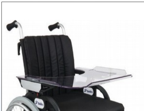
M1b. XL terapibord monteret