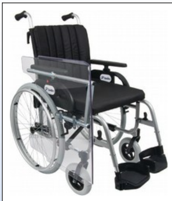
M2b. Terapiebord nedklappet