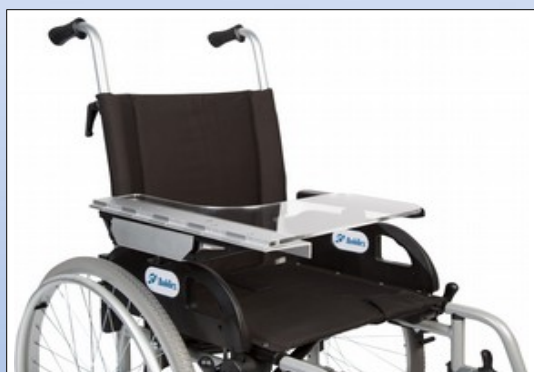
M1d. Halvsidigt terapibord

Fremstillet af 8 mm brudsikker transparent PETG. Terapibordet klemmes fast på armlænet med det unikke montagesystem som passer til armlæn i tykkelsen fra 28 til 58 mm. For tyndere armlæn kan der leveres en adapter.