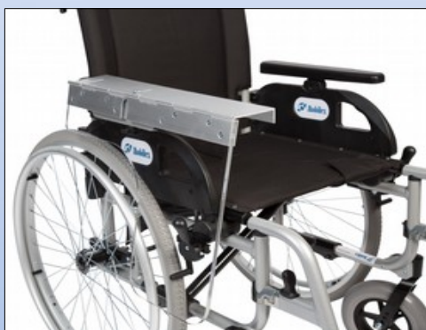
M1e. Halvsidigt terapibord nedklappet